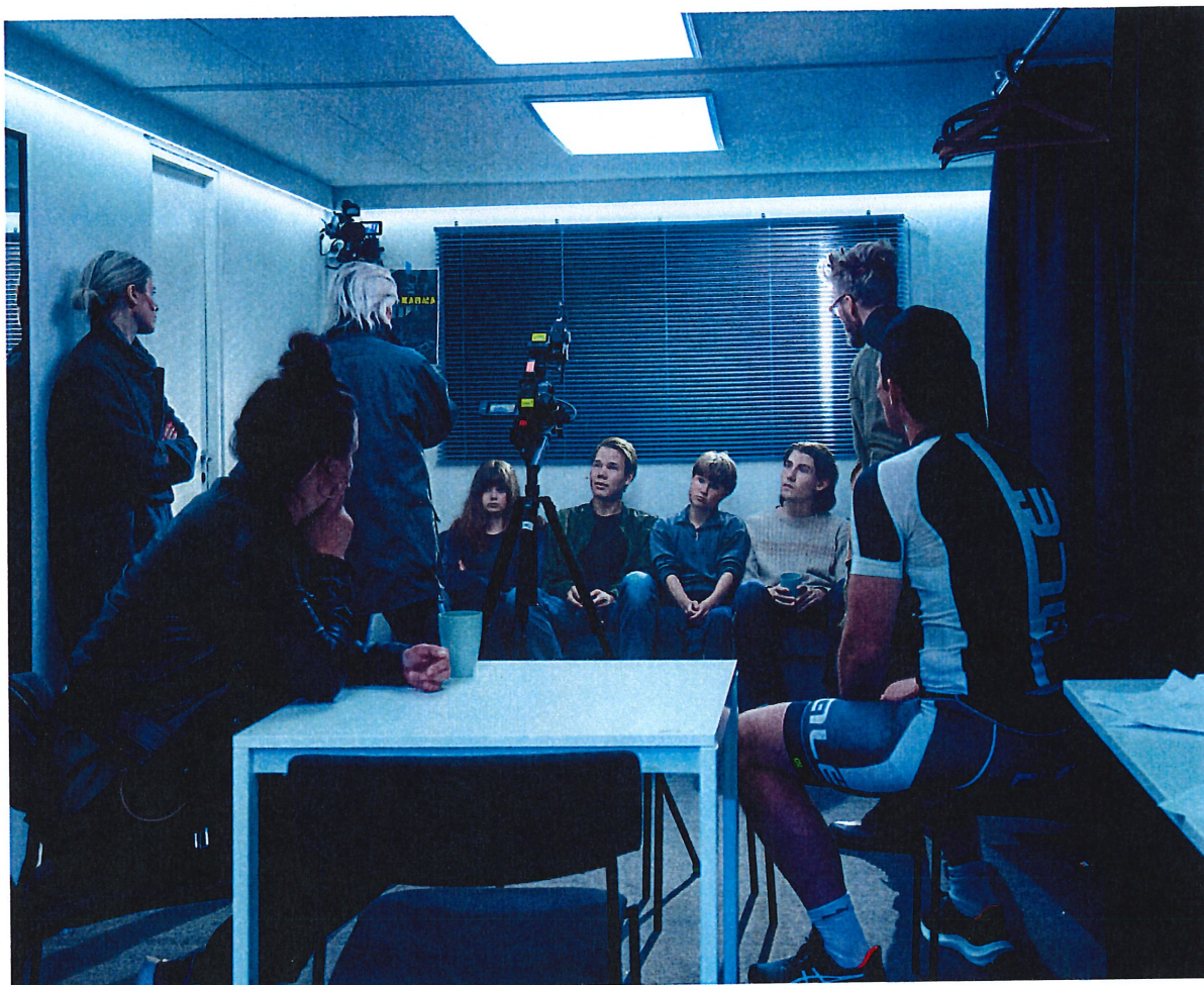
Vem dödade bambi?

Viirus rf tackar ödmjukast alla bidragsgivare, sponsorer och andra som understött såväl teaterns mångsidiga basverksamhet som utvecklingsarbetet på Busholmen 2023!